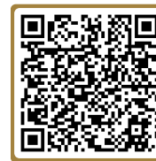
คู่มือการชำระค่าธรรมเนียม