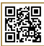
ระดับปริญญาตรี

เช่น ค่าเอกสารสำคัญทางการศึกษา, ค่าจัดส่งเอกสารทางไปรษณีย์, ค่าลาพัก, ค่าย้ายสาขาวิชา, ค่าโอนและเทียบโอนหน่วยกิต มีผลบังคับใช้ ภาคการศึกษา 2/2566