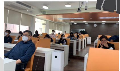
คณะเกษตรศาสตร์