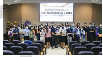
คณะพยาบาลศาสตร์