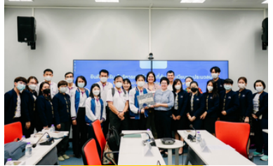
คณะเภสัชศาสตร์