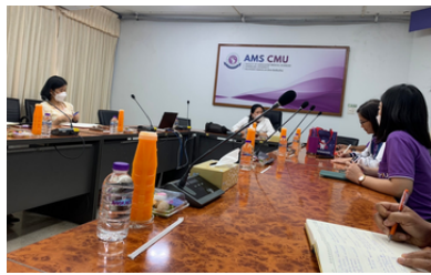
คณะวิศวกรรมศาสตร์