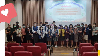
คณะทันตแพทยศาสตร์