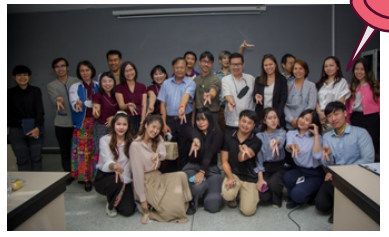
คณะรัฐศาสตร์