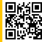
ระบบงานทะเบียนการศึกษา

เชิญน้องๆ รับเกรด ก่อนใ้กันจ้าาา โชค A นะครับทุกคน