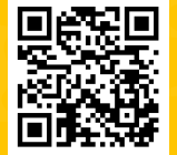
ระบบ Students Plus