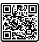
รายละเอียดการรับสมัคร

ดาวน์โหลดใบสมัคร และ หนังสือรับรองคุณสมบัติของผู้สมัครได้ที่ https://cmu.to/seconddegree